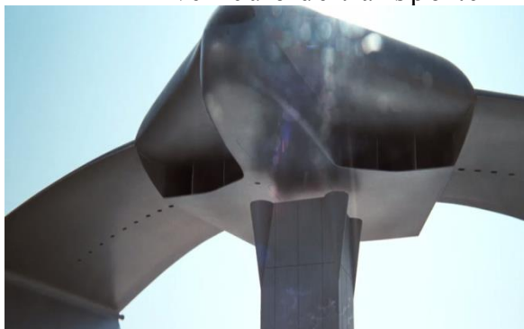
Vehículo de transporte